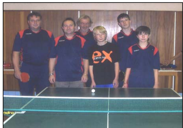
STO ŽITNA - RADIŠA „ B ”

V prvom čísle obecných novín sme si v krátkosti predstavili „A“ družstvo štatistiku. V tomto kalendárnom roku si pripomíname už piaty rok existencie „B“ družstva a po rokoch útlmu začali písať novú kapitolu starší hráči, ktorý zakladali „A“ mužstvo majú výkonnostný zenit za sebou. Vytvorené podmienky výstavbou kultúrneho domu sú ideálne, vďaka občanom v akcii Z a nevhodné malé priestory pre kultúru a stolný tenis sú minulosťou. Toto družstvo si veľké športové ciele nekladie. Prvá liga MO Bánovce je vyrovnanjšia, kde družstvá ťažia najmä z individuálnych schopností jednotlivcov. Pritom mať vlastných odchovancov je snom každého športového výboru a cudzí hráči niečo stoja, čo cítíme u futbalistov.