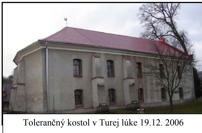
Tolerančný kostol v Turej lúke 19.12. 2006