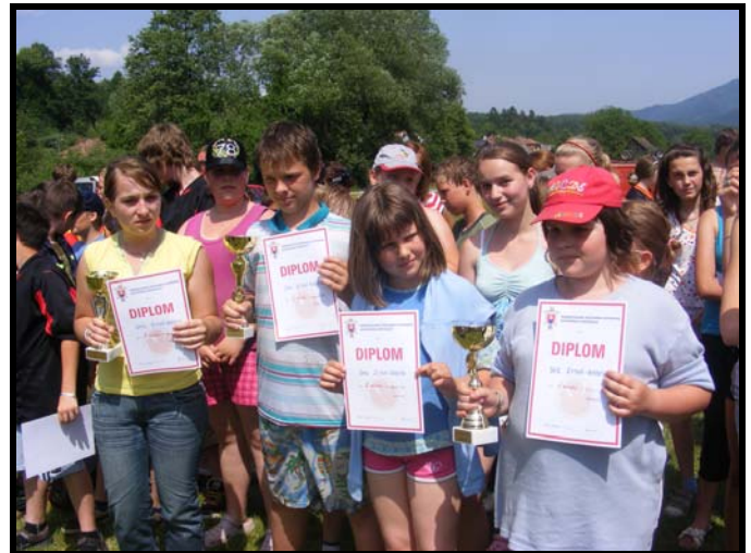
Družstvá za svoje umiestnenia získali tri pohárové trofeje.