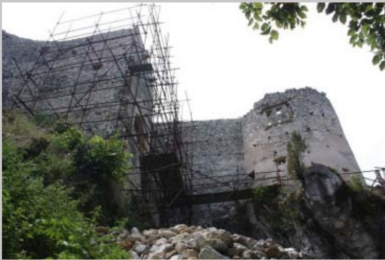
Vstupná brána a delová bašta

Financovanie má dva zdroje. Na nových zamestnancov nám prispieva na mzdy v plnej výške vrátane odvodov a sociálneho poistenia ÚPSVaR sumou asi 78000 €. Ostatné náklady na odborníkov a materiál budú hradené z príspevku Ministerstva kultúry vo výške 47000 €. Zatiaľ ešte zháňame príspevky na stravné lístky, ktoré sme povinní podľa zákona poskytnúť zamestnancom ako náhradu za stravu.