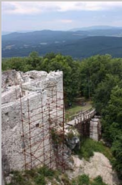
Pohľad z výšky na vstupný most