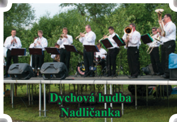
Dychová hudba Nadličanka