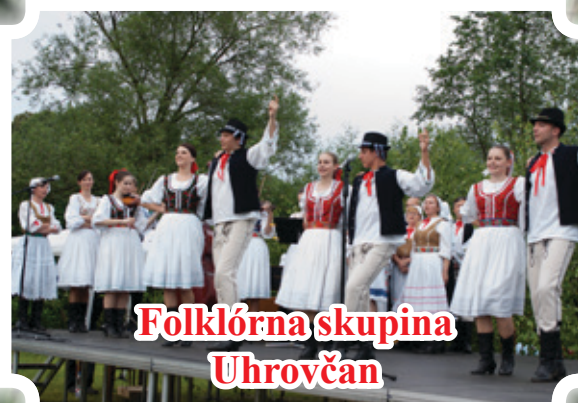
Folklórna skupina Uhrovčan