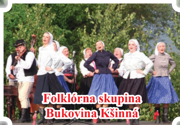
Folklórna skupina Bukovina Kšinná