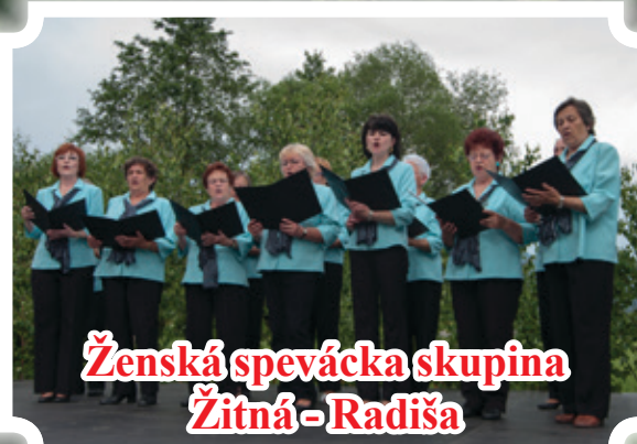
Ženská spevácka skupina Žitná - Radiša