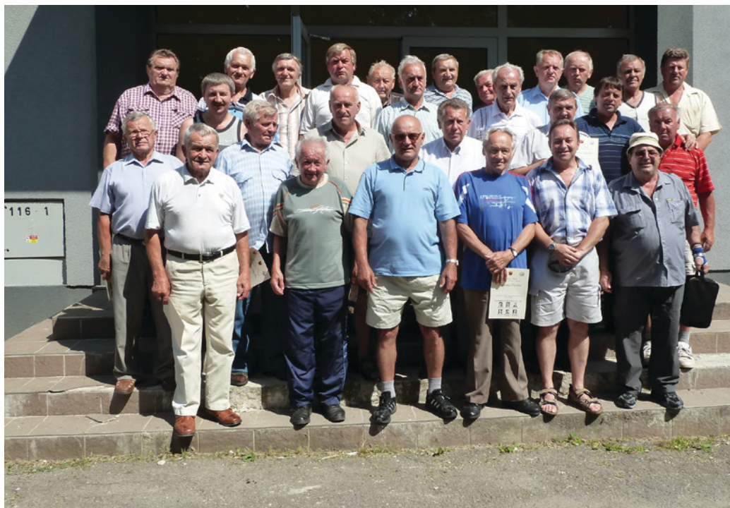
Spoločné foto zúčastnených hostí