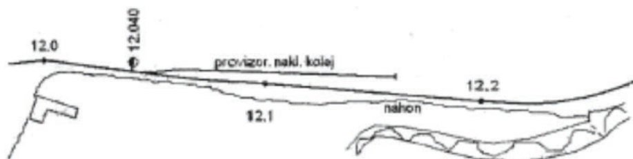
Nákres úzkokoľajky v časti obce Radiša

generácia. Spomeňte si, kto bol zamestnaný aj u ČSD (Československé štátne dráhy) s našej obce, Omastinnej, Uhrovského Podhradia a Kšínnej.