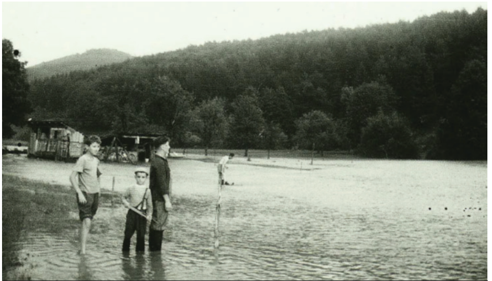
Vyliatie vody v časti Žitná 14. 6. 1966.